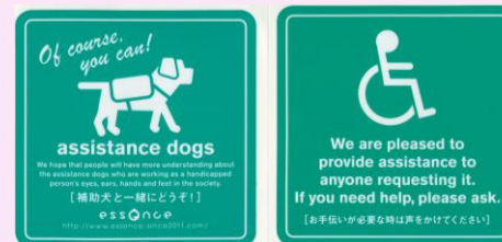
お店の雰囲気に合わせた 補助犬同伴ウエルカムのシール

自分たちの意思表示として、補助犬同伴受入のシールを独自のデザインで作りました。併せて海外の方にもわかるよう英語表記も入れています。