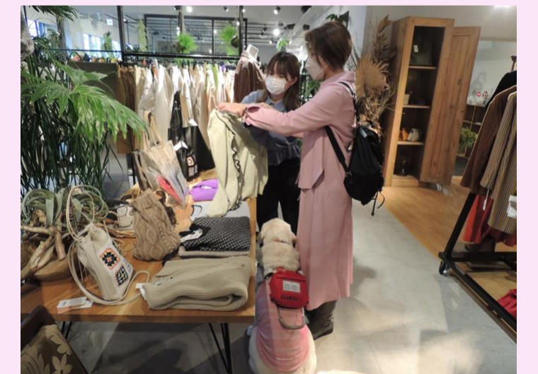
従業員が障害当事者として障害者に対する接客でのポイントをスタッフに助言できることの効果は大きい。

視覚障害者にとって「服選び」は困っていることのひとつです。自分の好みを伝えたり、予算に応じて選ぶことも難しいんです。そのことをスタッフさんにお話しして、どんな説明が必要かを理解していただきました。色や形、素材などを具体的に伝えていただいています。